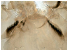
10.8 Potthastia gaedii