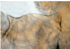
10.7 Potthastia longimana