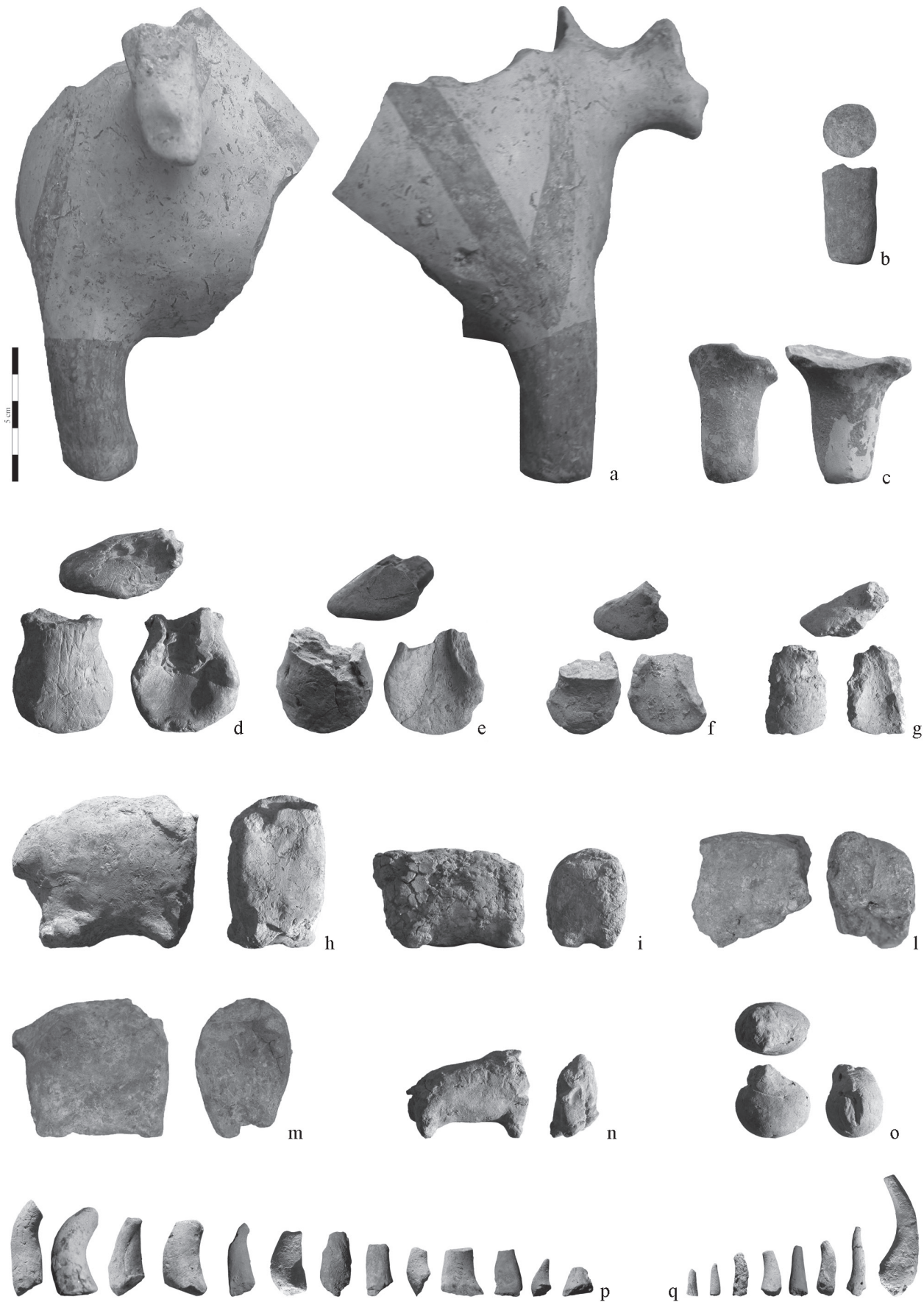
Fig. 2 - Vasi e idoletti zoomorfi dal villaggio di Colle Cera. (1/2 dimensione reale).