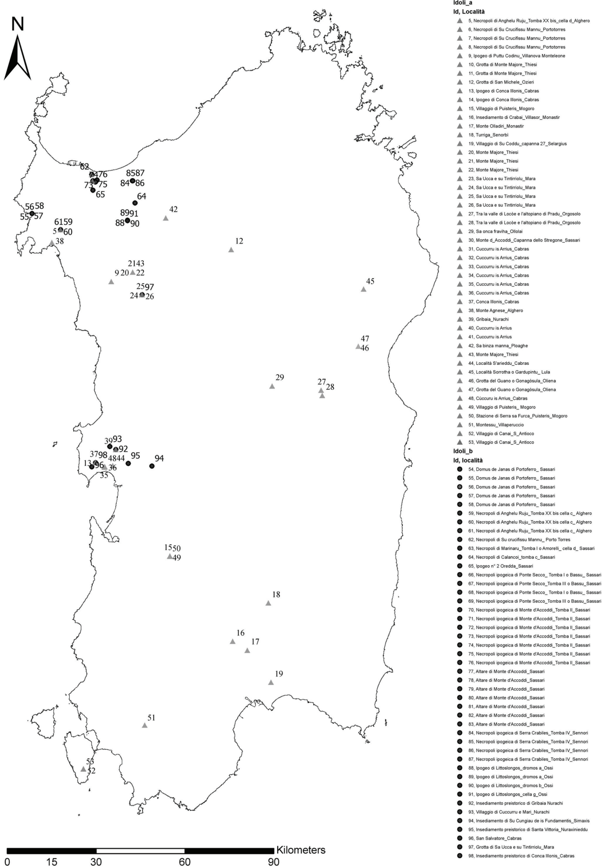
Fig. 2 - Carta di distribuzione degli idoli “cycladici” nei due gruppi A e B (Elaboraz. GIS L. Soro).