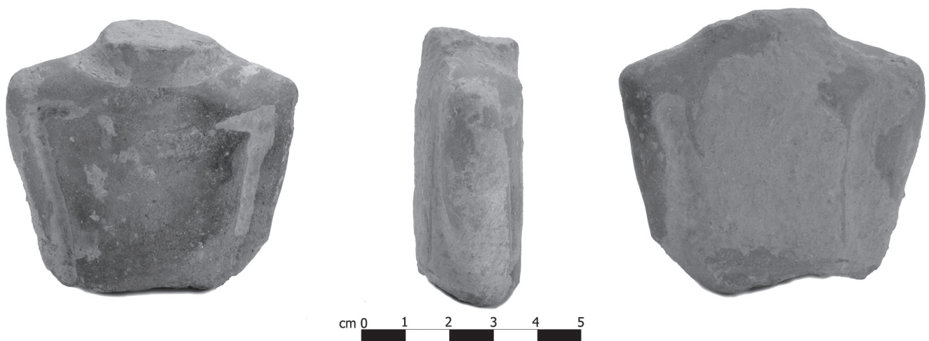
Fig. 3 - Frammento di idolo da Gribaia (Nurachi-OR).