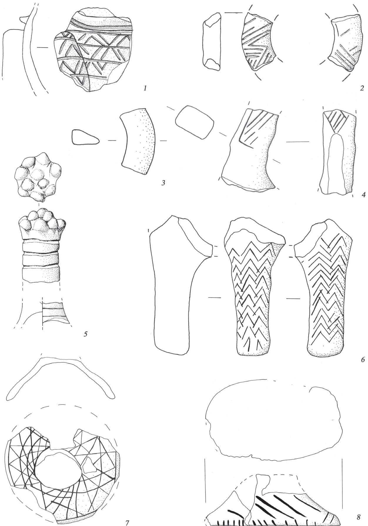
Fig. 2 - Sammardenchia di Pozzuolo del Friuli: 1-4 e 6. frammenti di rhyta; 5, 7-8. frammenti di ceramiche falloidi (1-6, 2:3; 7-8, 1:2). Fig. 2 - Sammardenchia - Pozzuolo del Friuli: 1-4 and 6. rhyta fragments; 5, 7-8 phallus-pottery fragments (1-6, 2:3; 7-8, 1:2).