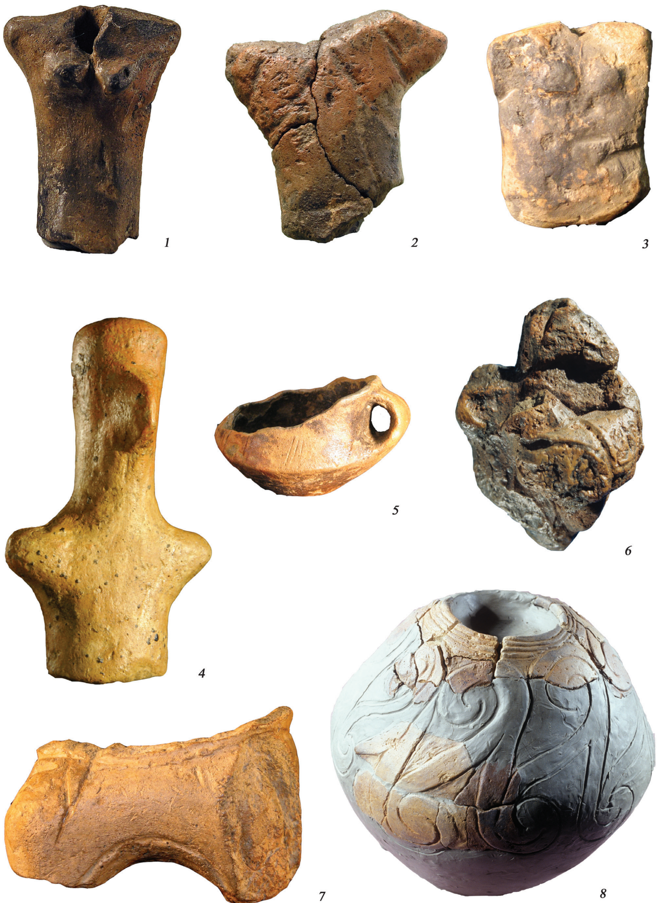
Fig. 3 - Sammardenchia di Pozzuolo del Friuli: 1-4 e 6. statuine in terracotta; 5. tazza Fiorano miniaturistica; 7. vasca di rhyton; 8. vaso con decorazione excisa (non in scala).